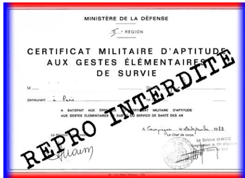
Certificat militaire d'aptitude aux gestes élémentaires de survie