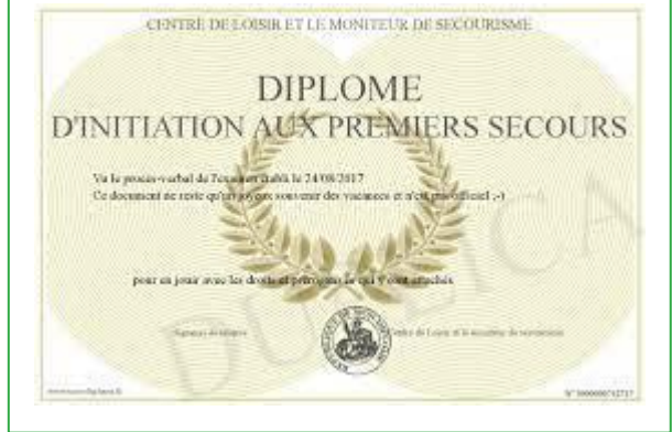
Attestation d'initiation aux gestes élémentaires de survie